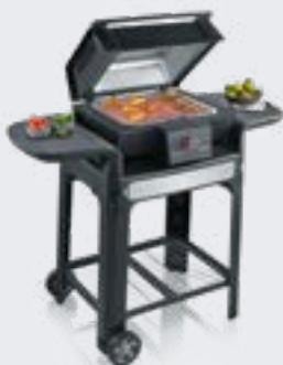
Barbecue électrique premium SEVO

eBBQ, c'est la (S)évolution du barbecue électrique. Pour un plaisir parfait, ne manquez pas les robustes stars du barbecue SEVO et SENOA ainsi que les acteurs secondaires intelligents qui viennent perfectionner le tout : des compositions d'épices tout droit sorties du hachoir universel, des quartiers de pommes de terre croustillants préparés dans la friteuse à air chaud ou de délicieux desserts concoctés dans la machine à glace. À découvrir maintenant – www.severin.com .