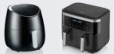
Friteuses à air chaud