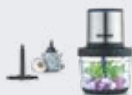
Hachoir universel sans fil