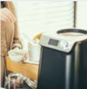
Turbine à glace – yaourtière